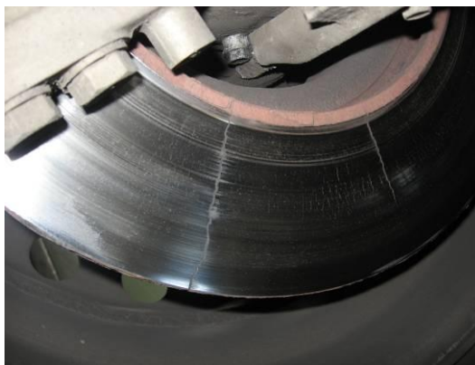
Prasklý brzdový kotouč.