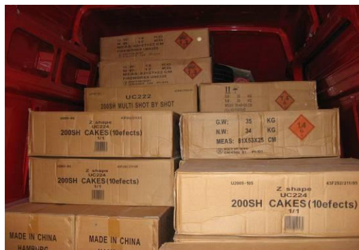
Přeprava výbušnin bez označení vozidla

Následuje kategorie rizik II , která představuje riziko poranění osoby nebo poškození životního prostředí. Zjištění takového nedodržení obvykle vede k provedení vhodných nápravných opatření, jako je požadavek nápravy na místě kontroly, pokud je to možné a vhodné, nejpozději však po dokončení přepravy.