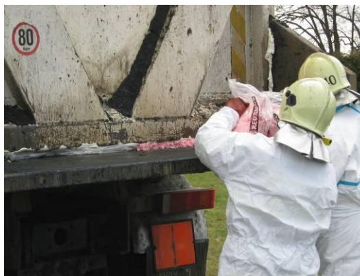
Zásah záchranné složky při zjištěném úniku nebezpečné látky ohrožující životní prostředí