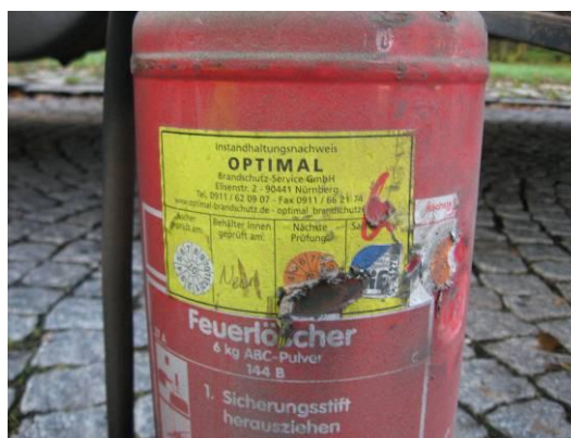
Nefunkční hasicí přístroj a hasicí přístroj s prošlou lhůtou kontroly.