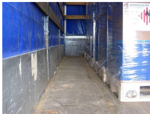
Kusová přeprava nebezpečných látek bez upevnění nákladu proti posunutí a pádu.