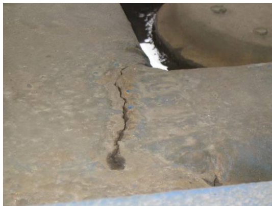
Prasklý rám cisternového vozidla.