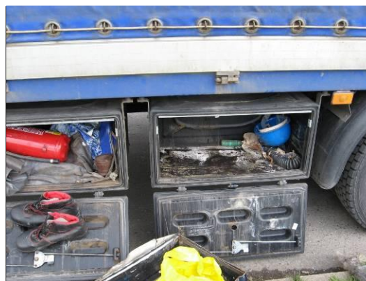
Nepatřičně uzavřené uzavírací zařízení na konci výpustného potrubí cisternového vozidla. Kontrola povinné výbavy v nevalné kvalitě

Poslední kategorií rizik je III , představující nízké riziko poranění osoby nebo poškození životního prostředí. Pokud vhodná nápravná opatření není třeba provést na místě, lze je provést později v podniku dopravce. Například: