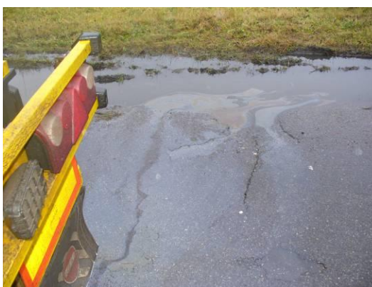
Únik nebezpečné látky UN 3082 z prostoru výpustného potrubí.