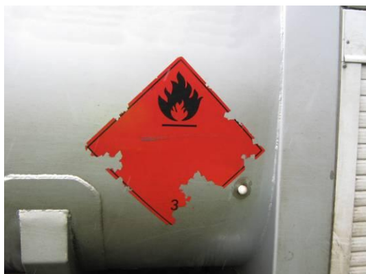
Poškozená velká bezpečnostní značka